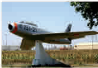
1959: Ala de Caza núm. 5, con aviones F-86 "Sabre"