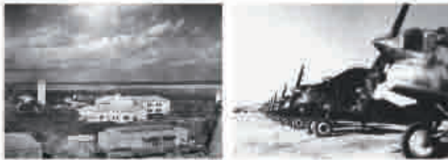
1953: Ampliación de la Base por los acuerdos con EE.UU.