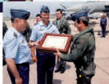
2004: Llegan los primeros C.16 (Eurofighter) a la Base.

El Ala 11 y Base Aérea de Morón, con dependencia orgánica del MANDO AÉREO GENERAL, tiene dos sistemas de armas; el C.16 del Grupo 11 y el P.3 del Grupo 22; la plantilla de hombres y mujeres que se aproxima a 1.500 personas -134 mujeres - se encuentran englobadas en los Grupos de Material, Apoyo, Sección Económico Administrativa y Secretaría General. De ellos, más de 600 son Tropa Profesional.