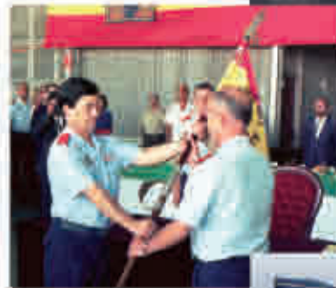
1999: Se lleva a cabo el cambio de denominación de Ala 21 por Ala 11