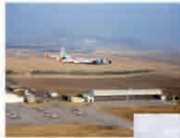
1992: Incorporación del Grupo 22 con aviones P.3. Sustitución de los F-5 por aviones C-101.