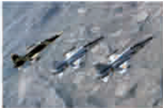
1970: Ala 21, con aviones F-5