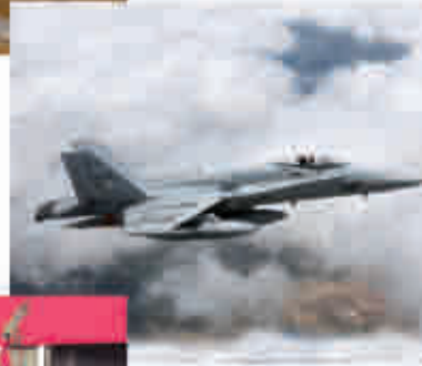
1995: Sustitución de los C-101 por aviones F-18.